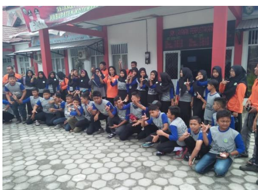
Kunjungan SD EKA TJIPTA TERAWAN