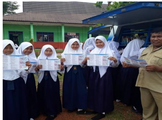
Perpustakaan Keliling di SMPN 1 Cempaga