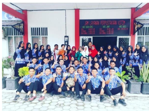
Kunjungan SMAN 1 Mentaya Hilir Selatan