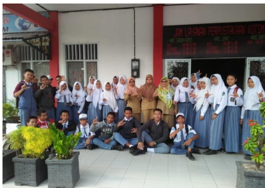
Kunjungan SMK MUHAMMADIYAH SAMPIT