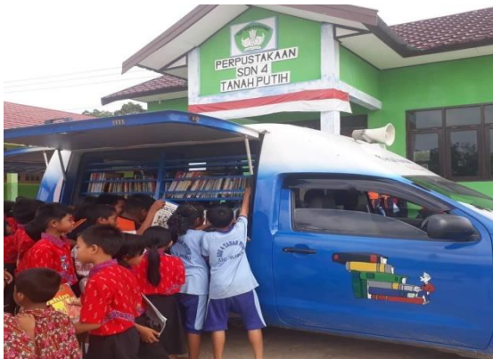
Perpustakaan Keliling di SDN 4 Tanah Putih