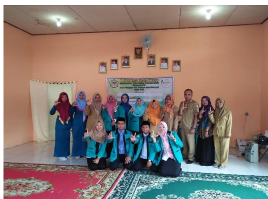
Perpustakaan Keliling berpartisipasi pada acara KKN

Perbandingan realisasi capaian kinerja sejak Tahun 2017 dengan Tahun 2019 disajikan pada tabel 3.3. berikut :