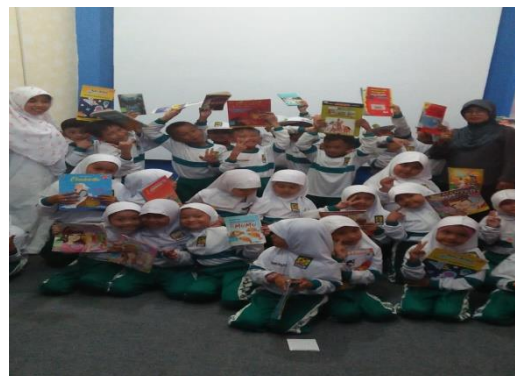
Kunjungan SD Islam Terpadu Arafah Sampit

Untuk mendukung tercapainya kinerja tersebut maka didukung oleh Program Pengembangan Budaya Baca dan Pembinaan Perpustakaan yang meliputi :