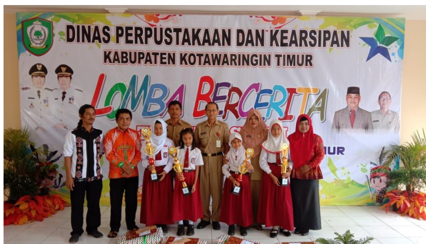
Pemenang Lomba Bercerita Tingkat SD/MI (Dokumentasi Bidang Layanan, Pengolahan dan Pengembangan Perpustakaan).

Membaca merupakan unsur penting dalam pendidikan, baik bersifat formal maupun non formal yang terus tetap dijaga dan ditingkatkan. Sedangkan lomba bercerita merupakan salah satu kegiatan untuk mengembangkan kegemaran membaca di bagi siswa SD/MI sekaligus untuk melestarikan budaya daerah, melalui cerita rakyat, akan menumbuhkan rasa kekaguman anak kepada khasanah kekayaan budaya bangsa.