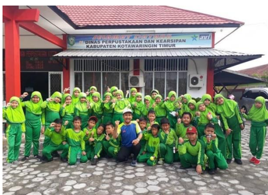
Kunjungan SD MIN Sampit

Pencapai sasaran kinerja 1 Dinas Perpustakaan dan Kearsipan Kabupaten Kotawaringin Timur dilaksanakan oleh indikator kinerja peningkatan jumlah pemustaka yang dilayani. Tahun 2019 jumlah pemustaka yang dilayani berjumlah 12.061 pemustaka. Bila dibandingkan tahun 2018 jumlah seluruh pemustaka yang dilayani berjumlah 12.796 pemustaka maka jumlah pemustaka mengalami penurunan sebesar 735 pemustaka. Bisa dilihat dari sisi target tahun 2019 yaitu sebanyak 17.364 pemustaka mengalami penurunan sebesar 7,92% atau hanya mencapai 69,45%.