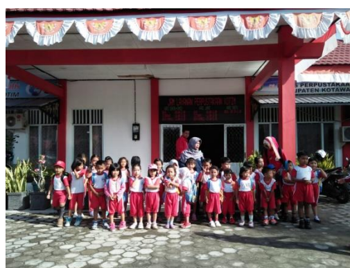
Kunjungan TK PAUD HARMONI