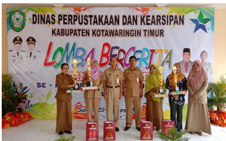
Foto 2 Pemenang Lomba Perpustakaan Sekolah Tingkat SMA/SMK/MA Th.2019 (Dokumentasi Bidang Layanan, Pengolahan dan Pengembangan Perpustakaan).

Pemenang Lomba Perpustakaan Sekolah Tingkat SMA/SMK/MA Tahun 2019 dimenangkan oleh :