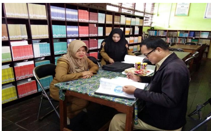
Kegiatan Penjurian Lomba Perpustakaan Tingkat SLTA/MA Tahun 2019 (Dokumentasi Bidang Layanan, Pengolahan dan Pengembangan Perpustakaan).

Keberhasilan pelaksanaan berbagai lomba pada Dinas Perpustakaan dan Kearsipan Kabupaten Kotawaringin Timur diharapkan dapat mendorong bertumbuhnya minat baca dan budaya gemar membaca di masyarakat Kabupaten Kotawaringin Timur.