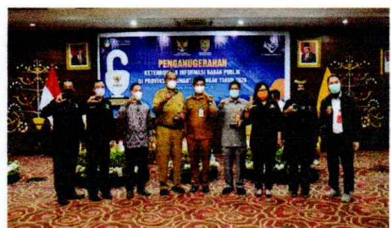
Gambar 1.2 PPID Utama Kabupaten Kotawaringin Timur menerima Penghargaan Keterbukaan Informasi Publik Tahun 2020 Tingkat Propinsi Kalimantan Tengah

Pemerintah Kabupaten Kotawaringin Timur berpartisipasi dalam Monitoring dan Evaluasi (Monev) Keterbukaan Informasi Publik Tahun 2020 yang diselenggarakan oleh Komisi Informasi