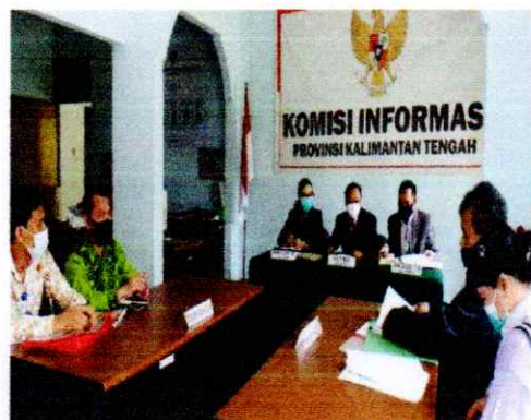
Gambar 4.1 Penyelesaian Sengketa Ke Komisi Informasi Provinsi Kalimantan Tengah